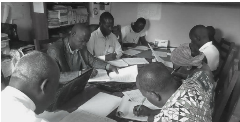
Réunion interne des membres du programme au siège du PCPA/DOL en présence du DD Plan; des OSC membres de la Bouenza et du Niari.

Cependant, compte tenu des difficultés financières du pays, plusieurs autres priorités n'ont pas pu être réalisées. Par contre, dans quelques territoires, ce sont les acteurs locaux, les autorités locales qui se sont emparés de ces besoins prioritaires mis à nu à travers le processus animé par le PCPA pour concrétiser ces projets. Par exemple, toutes les priorités de Djambala ont vu le jour (la crèche ; le préscolaire ; CSI ; l'adduction d'eau potable dans le village des autochtones).