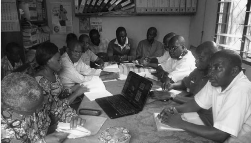
Réunion de concertation avec les chefs de quartier Kinguebé, Dimébéko, Mangandzi, Tsila; Le Directeur de l'école de Kinguebé et le Directeur du CEG Pierre Lountala de Dibéméko, les OSC membres du PCPA au siège PCPA/DO - 2016