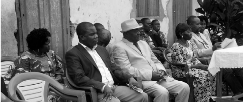
Lancement officiel de la collecte de la contribution des bénéficiaires pour le projet école de Mouyondzi.

Les membres du PCPA Congo ont beaucoup progressé dans leurs rapports avec les pouvoirs publics locaux. Cependant, des priorités d'actions sont à mettre en œuvre :